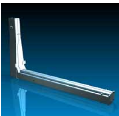
HAAKMAST 3D ART IMPRESSION